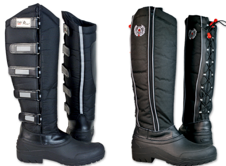
Tabela rozmiarów | Size chart Husky and Malamut